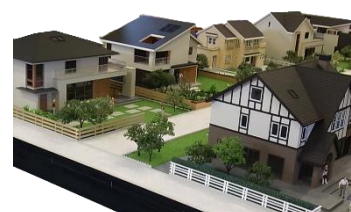
展示模型（イメージ）

本施設には、1/45 スケールの個性あふれるリアルな住宅模型を展示しています。お気に入りの商品を見つけて、大画面モニターを活用して、当社の戸建住宅に暮らすイメージや建物内部のデザインや空間をバーチャル体験していただくことも可能です。