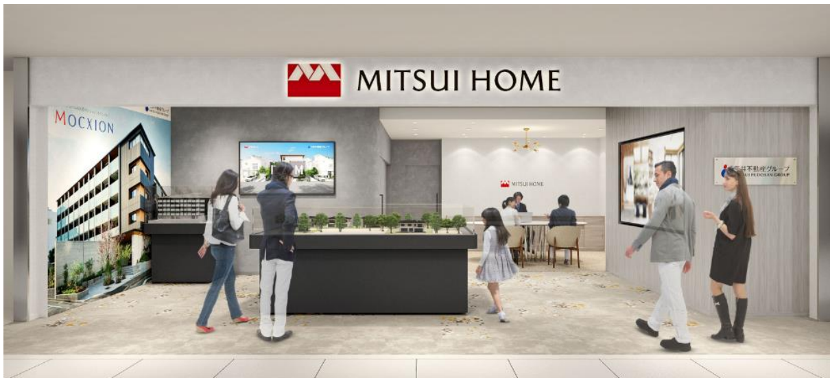
サロン内観イメージ

三井ホーム株式会社（本社：東京都新宿区、社長：池田 明）は、3月25日（土）に株式会社三越伊勢丹（本社：東京都新宿区）が運営する百貨店「伊勢丹浦和店」内に、住まいに関する相談サロン“三井ホーム「住まいの総合 SALON」”をオープンいたします。