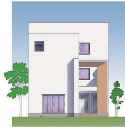
(クリエイティブタイプ)