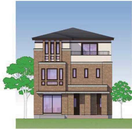
(トラディショナルタイプ)