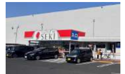
ドラッグストアアセキ 徒歩9分