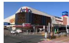
アリオ上尾 徒歩15分

【物件概要】●所在地/埼玉県上尾市菘丁目南30番23●交通/JR高崎線「上尾」駅下車徒歩40分/バス16分(新田前バス停まで徒歩2分)●用途地域/第1種低層住居専用地域●設備/都市ガス、公営水道、公共下水●建ぺい率/50%●容積率/100%●販売戸数/1戸●土地面積/195.94㎡●建物面積/96.30㎡●構造/木造(枠組壁工法)平屋建●間取り/2LDK●道路/北側約6.0m 公道 接面約12.8m、北西側約6.0m 公道 接面約10.2m●完成時期/2024年6月●取引態様/売主:三井ホーム株式会社※本物件は竣工時より置家具などを設置して内覧、案内可能な物件として使用中です。※図面内の置家具、小物等および車両は価格に含まれません。