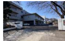
上尾市立大谷中学校 徒歩9分