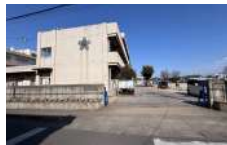
上尾市立大谷小学校 徒歩16分