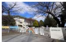
上尾市立平方東小学校 徒歩6分