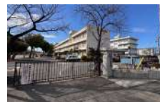
上尾市立大平中学校 徒歩2分