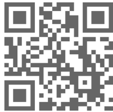
オフィシャルサイト