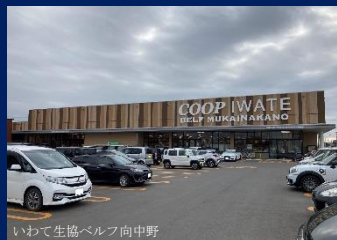
いわて生協ベルフ向中野