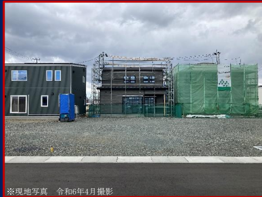
※現地写真 令和6年4月撮影