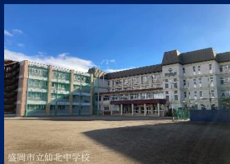
盛岡市立仙北中学校