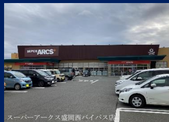
スーパーアークス盛岡西バイパス店