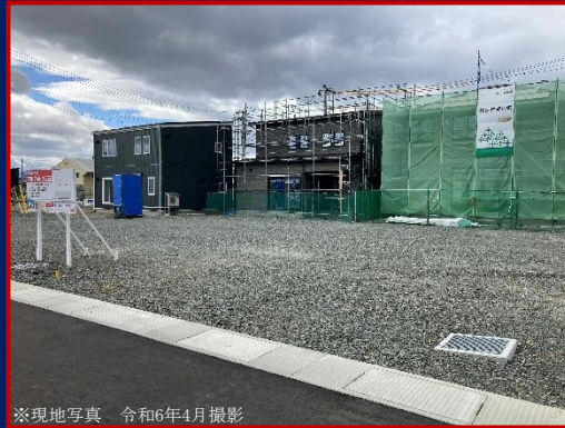
※現地写真 令和6年4月撮影