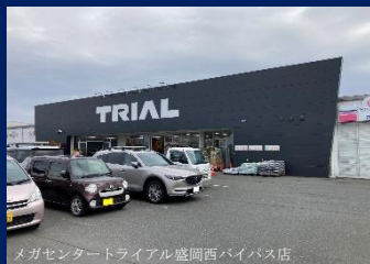
メガセンタートライアル盛岡西バイパス店