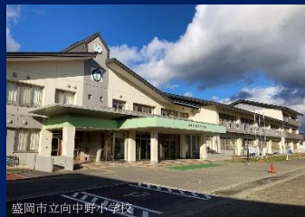
盛岡市立向中野小学校