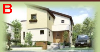
※写真はイメージで実物とは異なります。