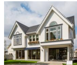
鈴鹿モデルハウス