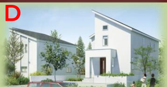
※写真はイメージで実物とは異なります。