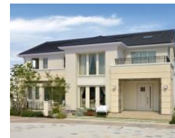
四日市 モデルハウス