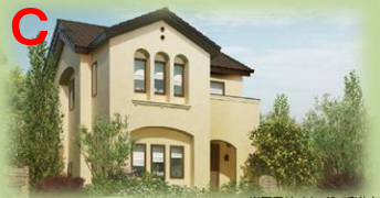
※写真はイメージで実物とは異なります。